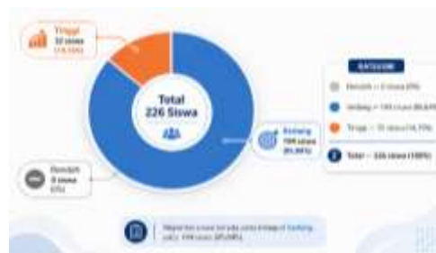
Gambar 2. Diagram Verbal Abuse Siswa

Verbal abuse siswa dominan berada kategori Sedang dengan total jumlah 194 siswa (85,84%), , sedangkan pada kategori tinggi berjumlah 32 siswa dengan persentase (14,15%). Ini menunjukkan bahwa mayoritas siswa memiliki kecenderungan mengalami verbal abuse. Gambaran ini menunjukkan bahwa verbal abuse bukanlah fenomena yang terjadi secara kebetulan, melainkan bagian tak terpisahkan dari dinamika interaksi sehari-hari para siswa. Dominasi kategori “sedang” menunjukkan bahwa praktik, pengalaman, atau paparan terhadap verbal abusermasih cukup umum dalam kehidupan sosial para siswa, meskipun tidak selalu terjadi dengan intensitas yang ekstrem (Holt & Birchall, 2023). Temuan ini sejalan dengan penelitian Apriatama et al., (2025) dan Juliansyah et al., (2025) yang menemukan bahwa verbal abuse di kalangan remaja sering dianggap sebagai kejadian umum dalam interaksi sosial, namun hal ini terkait dengan peningkatan kecemasan dalam berkomunikasi dan penurunan harga diri di kalangan siswa. selain itu tindakan verbal abuse di kalangan siswa sering terjadi secara signifikan berkorelasi dengan penurunan harga diri yang rendah dan depresi (Safitri & Sari, 2024).