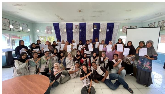
Gambar 2. Sosialisasi UMUM Dalam Proses Penerbitan NIB

Hasil pengabdian menunjukkan bahwa program sosialisasi yang dilakukan mampu meningkatkan pemahaman dan partisipasi pelaku UMKM dalam proses penerbitan Nomor Induk Berusaha (NIB). Hal ini sejalan dengan temuan Ritzer dan Stepnisky (2017) yang menyatakan bahwa sosialisasi efektif dapat mengubah sikap dan perilaku masyarakat terhadap layanan publik. Pelaku UMKM yang sebelumnya kesulitan memahami prosedur kini lebih percaya diri karena metode penyampaian informasi yang interaktif dan pendampingan langsung.